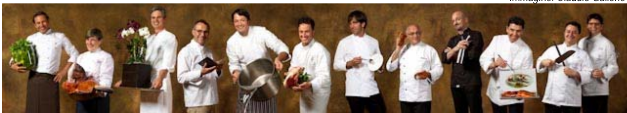
Immagine: Claudio Gallone

Le ricette del Menù della Nazionale del Gusto saranno disponibili online sul sito www.birramoretti.it